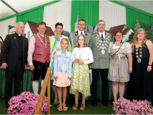
Kirchweih und Schützenfest am Sonntag, dem 2. Juli 2023 Gekrönte Majestäten des Jahres 2023