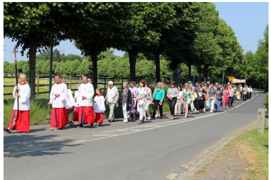
Fronleichnam am Donnerstag, 8. Juni 2023