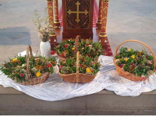
Kräutersträuße an Mariä Himmelfahrt am Dienstag, 15. August 2023