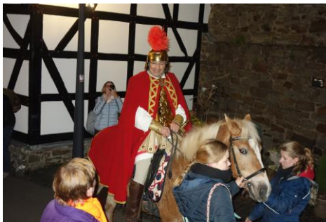
Sankt Martin reitet durch Stadt Blankenberg

Nach dem grandiosen Martinszug im vergangenen Jahr, an dem bei bestem Novemberwetter so viele Kinder mit ihren Eltern, Großeltern und Freunden teilgenommen hatten, wie lange nicht mehr, wird die Pfarrgemeinde Sankt Katharina auch in diesem Jahr gerne wieder die Feierlichkeiten zu Sankt Martin vorbereiten.