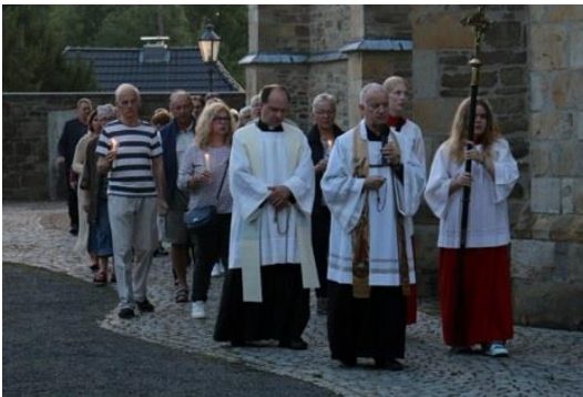
Lichterprozession am Vorabend zu Mariä Himmelfahrt am Montag, 14. August 2023