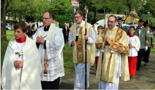
Kompassionsfest mit Erzbischof Woelki am Freitag, 5. Mai 2023